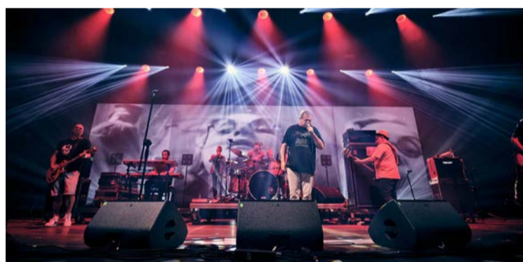
Kult był gwiazdą festiwalowej odsłony Summer Areny