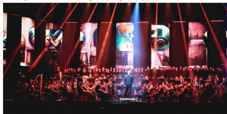
Muzyka filmowa - mocny punkt wydarzeń Areny