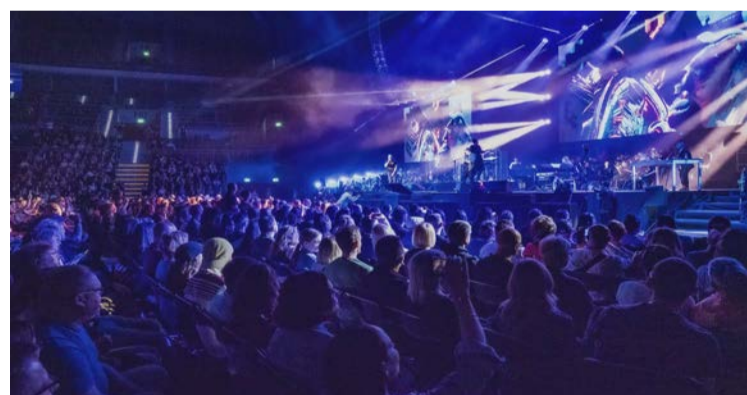
Dwie edycje koncertu Zrozumieć Śląsk przyciągnęły tłumy gości