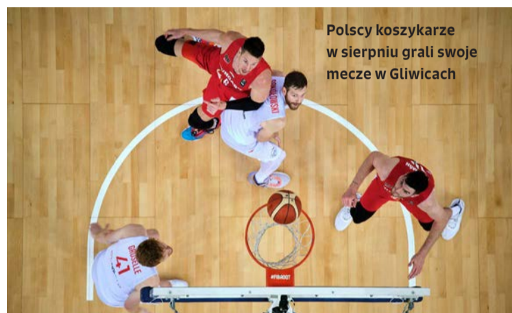
Polscy koszykarze w sierpniu grali swoje mecze w Gliwicach