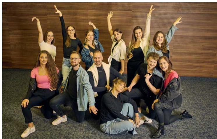
Dance Arena Gliwice - taneczna ekipa prowadząca zajęcia przez cały rok