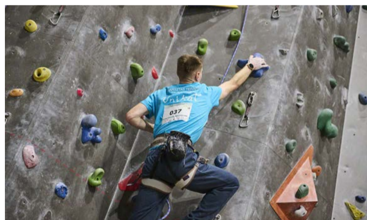
Tysiące gości odwiedziło także ścianę wspinaczkową Chwyciarnia