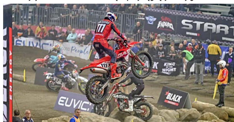
Takie widowiska jak Super Enduro są niezwykle wymagające organizacyjnie