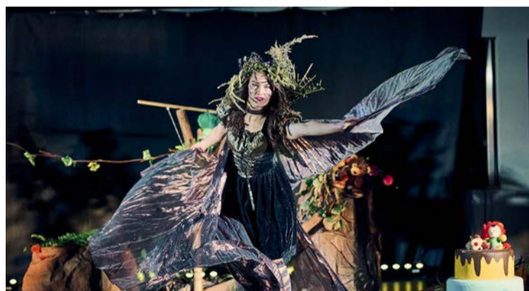
Cały rok towarzyszyły nam emocje Poranków Teatralnych