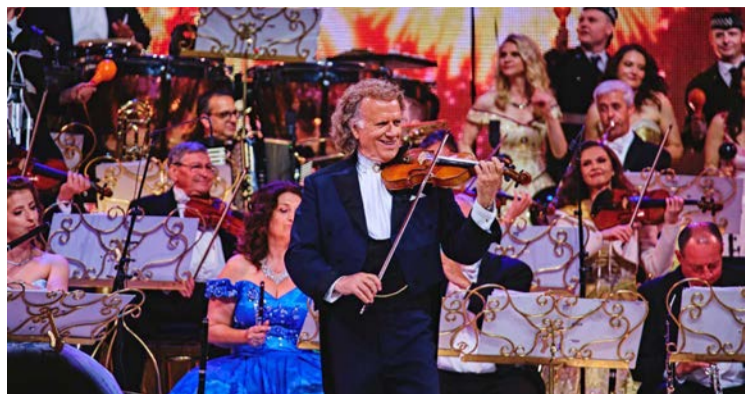
Andre Rieu - już w czerwcu zagra ponownie w Gliwicach