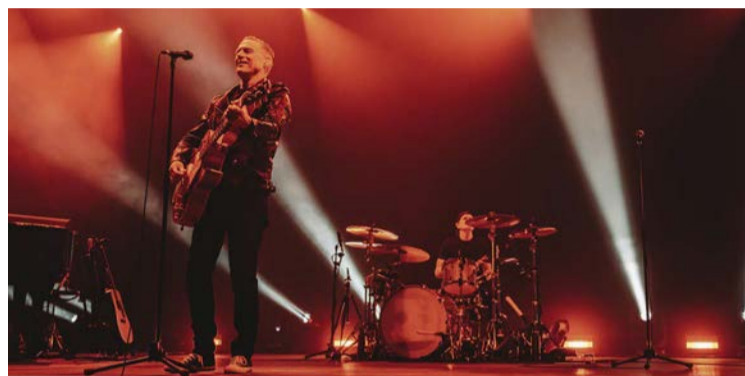
Bryan Adams zagrał tu największy koncert w Polsce