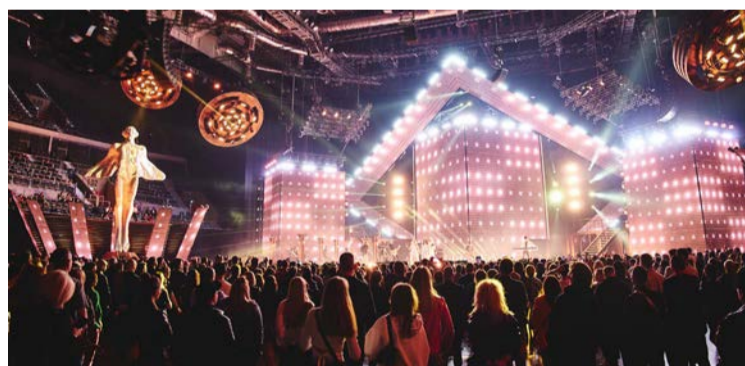
Gala Fryderyków po raz pierwszy odbyła się w Gliwicach