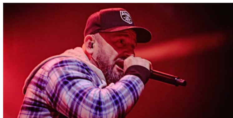
Liroy - gwiazda festiwalu Legend (druga edycja w marcu!)